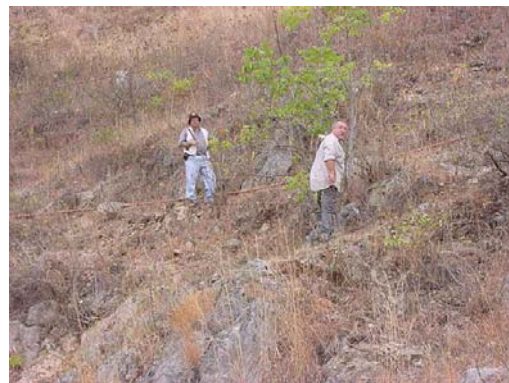
PROFESIONALES DE LA DIRECCIÓN GENERAL DE MINERÍA, REALIZANDO MUESTREOS DE CAMPO EN UNO DE LOS DEPÓSITOS DE CALIZA FOSILÍFERA DETECTADOS