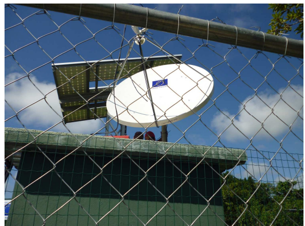
La torre del sistema fotovoltaico y la antena satelital