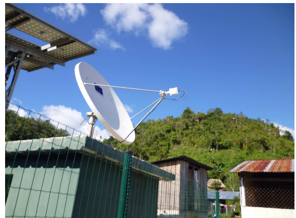
La torre del sistema fotovoltaico y la antena satelital