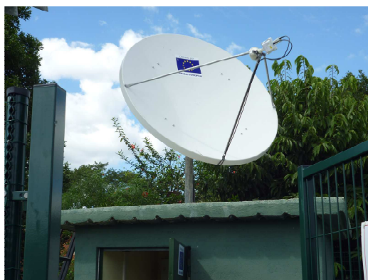
La torre del sistema fotovoltaico y la antena satelital