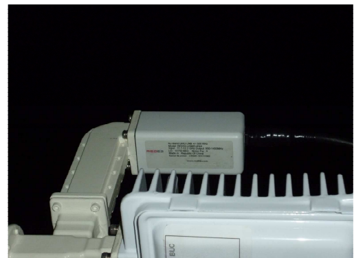
El ODU, componente de la Antena Satelital