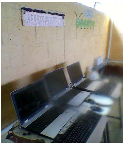
El salón en el que se encuentran las cinco computadoras tipo laptop.

La Comunidad se encuentra bien organizada ya que es de fácil la comunicación con cualquier miembro del comité, obtienen ingresos por uso productivo del Kit aunque es muy bajo. (Anexo Ficha de Monitoreo).