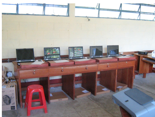
El salón en el que se encuentran las cinco computadoras tipo laptop

La Comunidad se encuentra bien organizada ya que es de fácil la comunicación con cualquier miembro del comité, se encuentran dando clases a los alumnos ya establecieron horarios, obtienen ingresos para darle sostenibilidad del Programa.