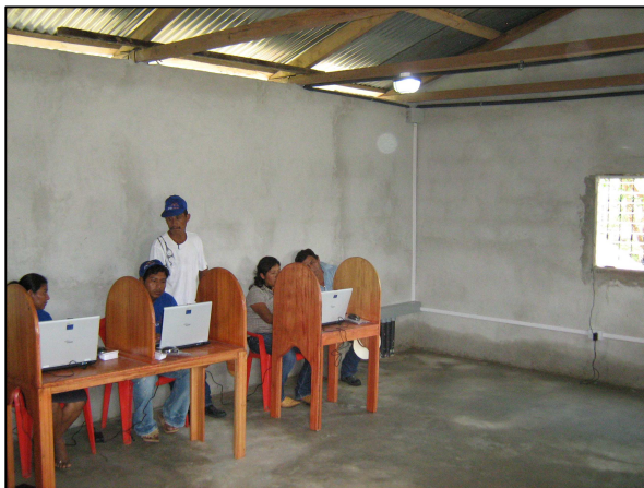
El salón en el que se encuentran las cinco computadoras tipo laptop

La Comunidad se encuentra bien organizada ya que es de fácil la comunicación con cualquier miembro del comité, obtienen ingresos por uso productivo del Kit. (Anexo Ficha de Monitoreo).