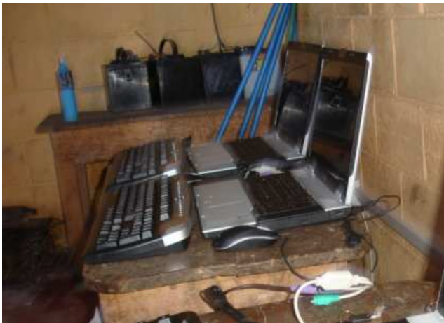
El salón en el que se encuentran las cinco computadoras tipo laptop

La Comunidad se encuentra bien organizada ya que es de fácil la comunicación con cualquier miembro del comité, obtienen ingresos para darle sostenibilidad del Programa.