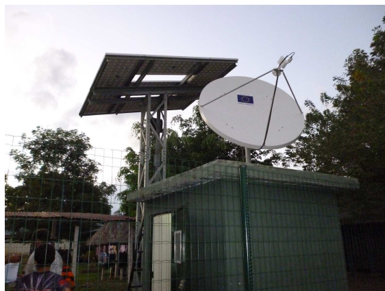
La torre del sistema fotovoltaico y la antena satelital