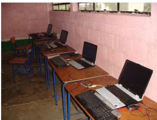
El salón en el que se encuentran las cinco computadoras tipo laptop

La Comunidad se encuentra bien organizada ya que es de fácil la comunicación con cualquier miembro del comité, el centro tecnológico esta autorizado por el Ministerio de Educación, obtienen ingresos para darle sostenibilidad del Programa.