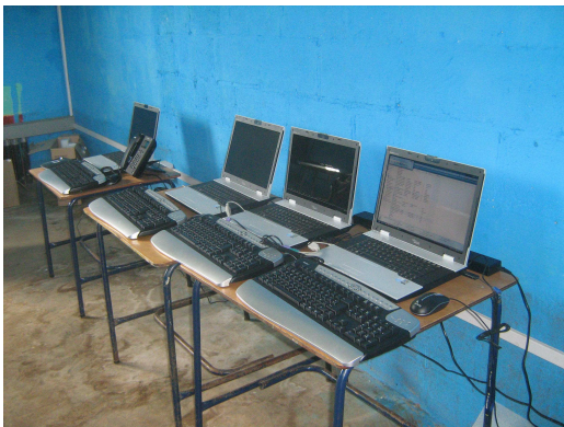
El salón en el que se encuentran las cinco computadoras tipo laptop

La Comunidad se encuentra bien organizada ya que es de fácil la comunicación con cualquier miembro del comité, pero tienen el inconveniente que no tienen capacitadores para el uso del equipo han pedido apoyo a la Municipalidad pero no han tenido éxito. A partir de enero 2012 cuentan con Energía Eléctrica, no han obtenido ningún ingreso para la sostenibilidad del Programa.