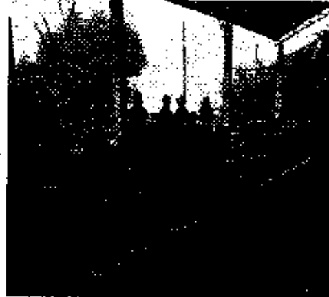
Reunión de trabajo en comunidad Xeucaivitz