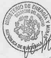
Alberto Pimentel Mata Ministro de Energía y Minas Ministerio de Energía y Minas

"Contribuyendo por el país que todos queremos"