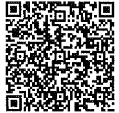
Alberto Pimentel Mata Ministro de Energía y Minas Ministerio de Energía y Minas